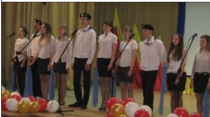
Фестиваль солдатской песни в Агинской СОШ №2