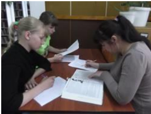
Сверка списка погибших на обелиске с книгой ПАМЯТИ унерскими школьниками