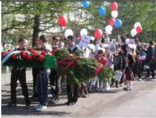
Шествие школьников к месту проведения митинга в с. Унер