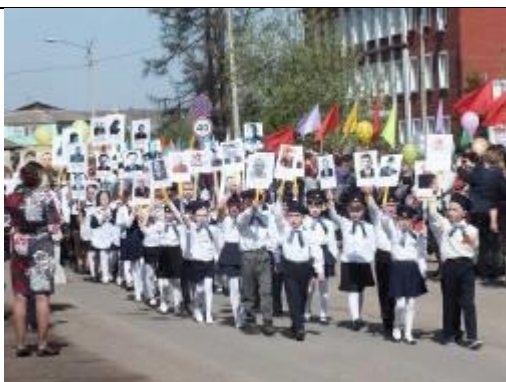
Участие агинских школьников в акции «Бессмертный полк».