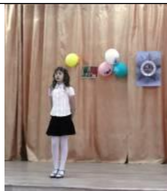
Конкурс чтецов в Унерской СОШ