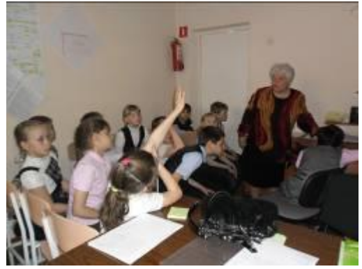
Урок памяти в Агинской СОШ №2