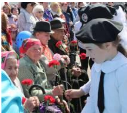
Поздравление ветеранов на митинге 9 мая школьниками Агинской СОШ №2