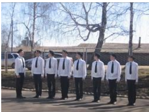
Команда "Единство" Агинской школы №2 заняла I место