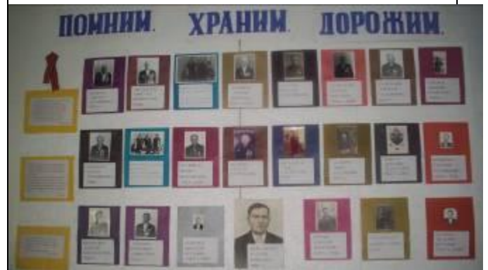
Оформление стенда - «ПОМНИМ. ХРАНИМ. ДОРОЖИМ.» в Орьевской СОШ