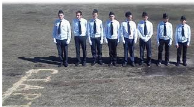
Команда Агинской СОШ №1