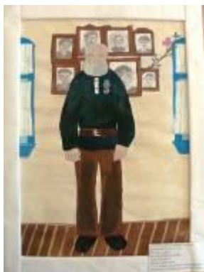
«Отец восьми погибших сыновей» - рисунок ученицы Большеарбайской СОШ, победитель конкурса