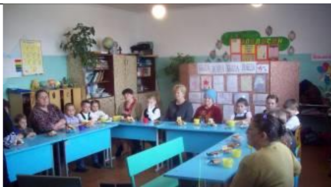
Встреча с тружениками тыла, детьми ветеранов ВОВ в Орьевской СОШ