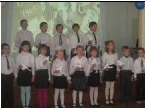
Гладковские школьники выступили с концертом перед жителями села