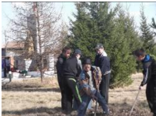
Уборка территории у обелиска с. Унер