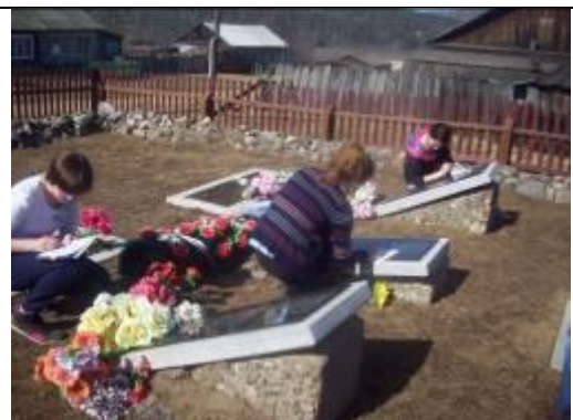
Исследовательская работа. Паспорт объекта, увековечивающего память погибших в ВОВ п.Орье