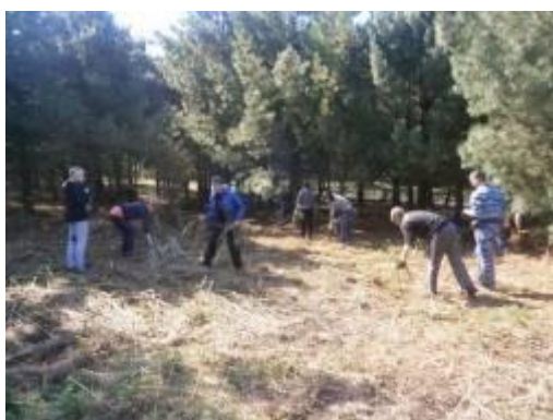
Уборка парка Победы с. Вознесенка