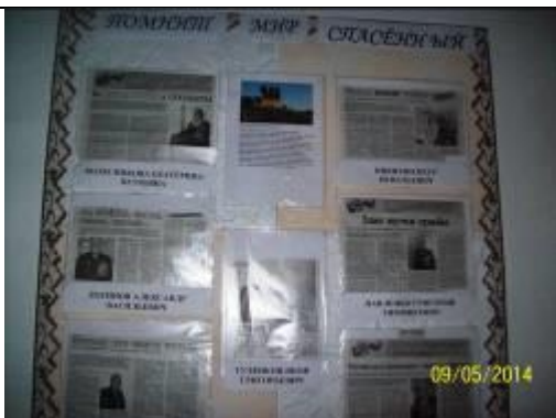
Стенд в Большеарбайской СОШ, посвященный ветеранам ВОВ проживающим в Саянском районе.