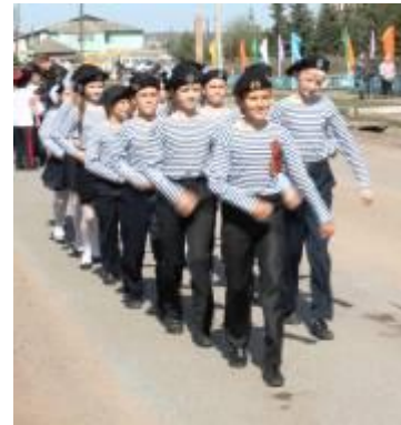
Отряд «Юность» Агинской СОШ №2