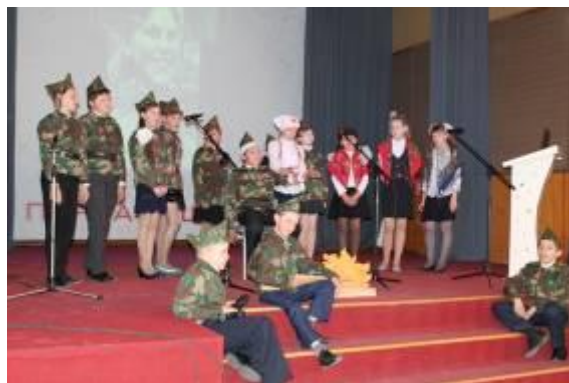
Фестиваль инсценированной военной песни «Песни военных лет» в Агинской СОШ №1