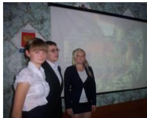
Урок памяти в Вознесенской СОШ