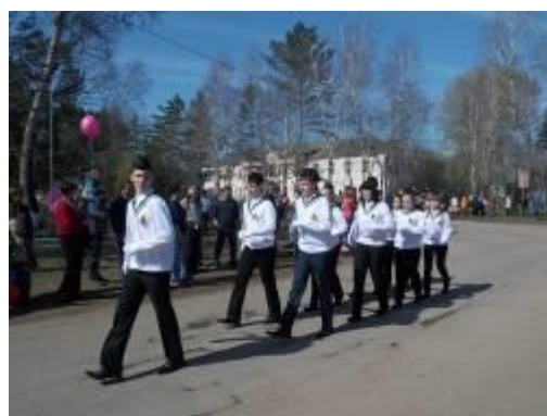
Отряд юнармейцев Агинской СОШ №1